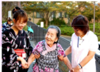
季節のお祭り風景