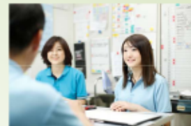
一人ひとりに合わせたリハビリ、介護、看護、栄養サービスの提供