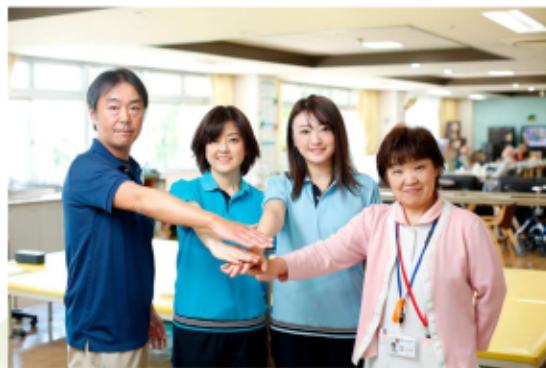
「慈愛と共生」ともに笑顔のある暮らし