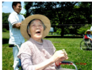
新緑散策 (北八朔公園)